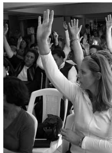
Categoria presente na Assembléia aprova disposições propostas

Todas as informações sobre os detalhes das propostas discutidas na Assembléia você poderá ficar sabendo na próxima edição de nosso informativo e ainda em nosso novo site: www.secraso-rs.com.br